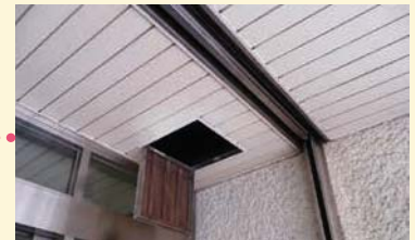
玄関横シャッター周り