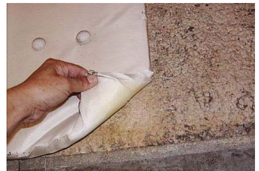
※写真はグラスウール貼りの裏にあった吹付け材です。

http://www.jesc.or.jp/info/asbestos/02.html