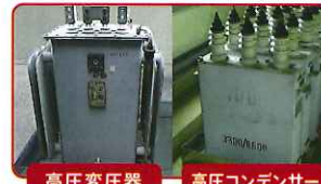
高圧変圧器 高圧コンデンサー