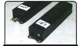
業務用・施設用蛍光灯の安定器