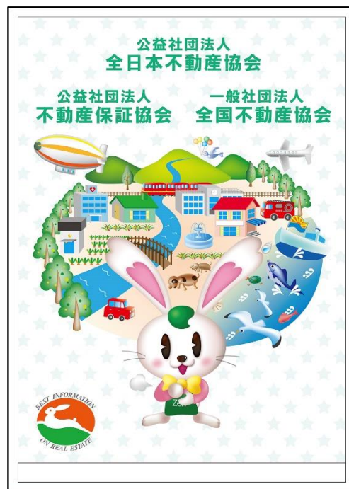
ポスター(表紙裏面)