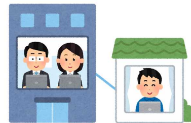
間仕切り壁等の新設