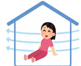
換気・省エネ など