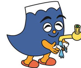
感染予防・家事負担軽減