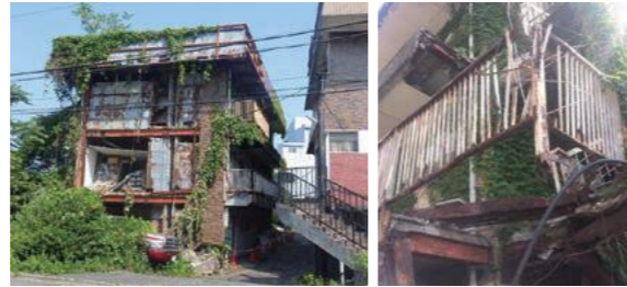
適正な維持管理が行われなくなったマンションの例