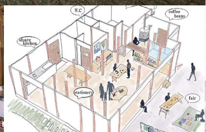
チャレンジシェアテナント「SUSONOTOWA」(裾野市)