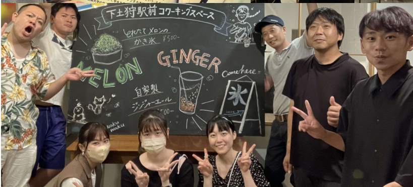
「下土狩駅前コワーキングスペース」(長泉町)を活用したイベント