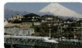
JR三島駅から快適新幹線通勤!