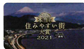
2021年広小路駅周辺受賞