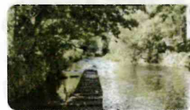
市街地を流れる源兵衛川