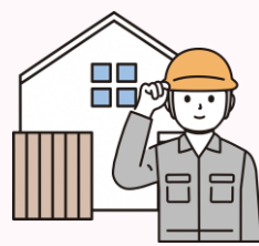
住宅のリフォーム 増築